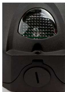
Skymningsrelä (tänder under 30 lux)