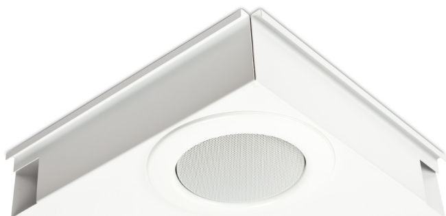
Vit monteringsplåt (RAL-kod 9003, glans 30)

En liten och smidig 5" högtalare med inbyggd 100V trafo och med keramisk kopplingsplint. Högtalaren är EN54 certifierad och passar för infälld takmontering. Vi har tagit fram en specialplåt för montering i systemundertak.